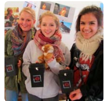
Konfirmander ved Sogne- indsamlingen den 13. marts