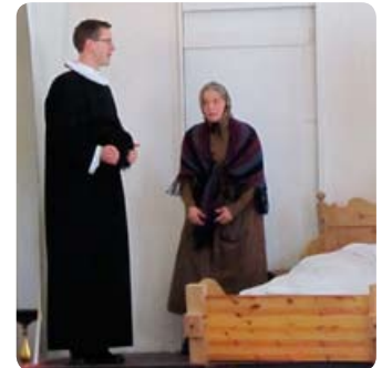
Optrin i kirken på konfirmanddagen