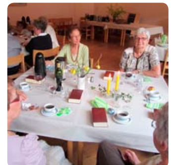
Skærtorsdagsmiddag i Sognegården