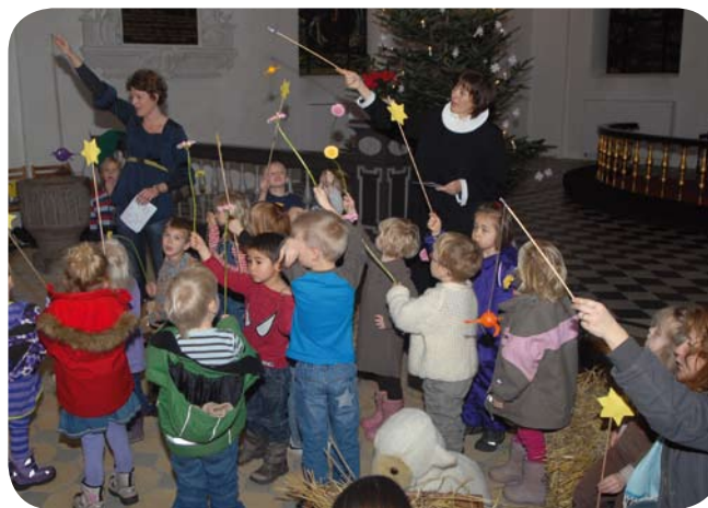
Hvem skabte stjernerne?