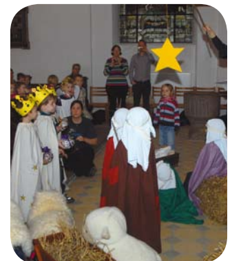
Stjernen over Betlehem