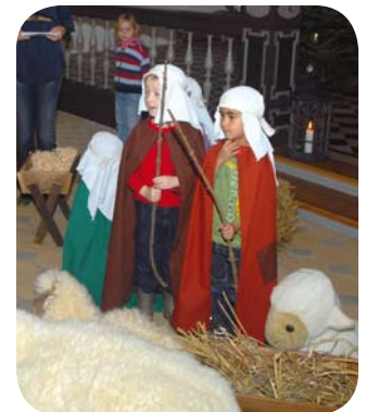
Hyrderne på marken