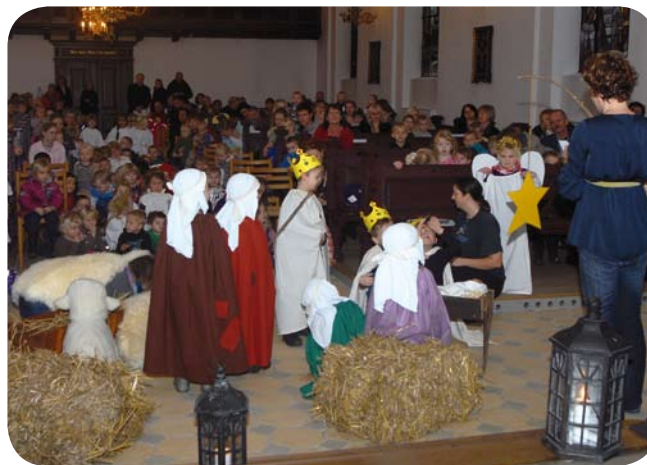
Børn, forældre og bedsteforældre